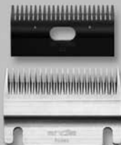
Blade Set Rodeo-23 #70340

Special blades for dirty cattle hair Coat length after clipping 2-4 mm Hojas especiales para el pelaje sucio del ganado vacuno. Longitud del pelaje después de recortar 2-4 mm Lames spéciales pour poils sales Longueur de poil après la tonte 2-4 mm