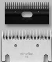
Blade Set 18-23 #70345

Special udder clipping blade set Juego de hojas especiales para recortar ubres Jeu de lames spécial pour tonte de pis