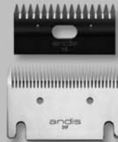
Blade Set 31F-15 #70315

Wider spaced teeth on bottom blade for "tough" clipping of beef and dairy cattle Dientes con mayor espaciado en la hoja inferior para los recortes "dificiles" en ganado vacuno cárnico y lácteo Dents plus espacées sur la lame inférieure pour la tonte « grossière » du bétail et des vaches laitières