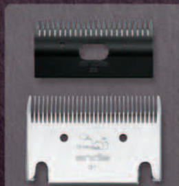
Blade Set 31-23 #70225