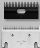
Blade Set 53A-23 #70355

Plucking blade, leaves longer hair Coat length after clipping 5 mm Hoja para arrancar, deja un pelaje más largo. Longitud del pelaje después de recortar 5 mm Lame à épiler, laisse le poil plus long Longueur de poil après la tonte 5 mm