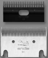
Blade Set 31-23 #70225

Optional blades available through your supplier • Hay hojas opcionales disponibles por medio de su proveedor • Lames en option en vente chez votre fournisseur