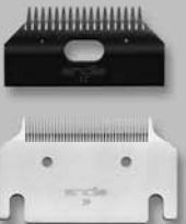
Blade Set 39-17 #70350

Special udder clipping blade set Juego de hojas especiales para recortar ubres Jeu de lames spécial pour tonte de pis