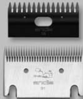
Blade Set 31-15 #70325

General purpose for horses and cattle Usos generales para ganado vacuno y equino Lames polyvalentes pour chevaux et bétail