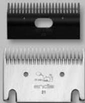
Blade Set 21-23 #70320

General purpose for horses and cattle Usos generales para ganado vacuno y equino Lames polyvalentes pour chevaux et bétail