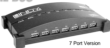
7 Port Version