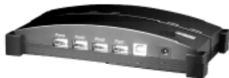
4 Port Version