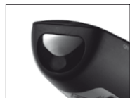
* This point aperture can produce CLASS 2 laser energy

LASER RADIATION: DO NOT STARE INTO BEAM. CLASS 2 LASER PRODUCT.