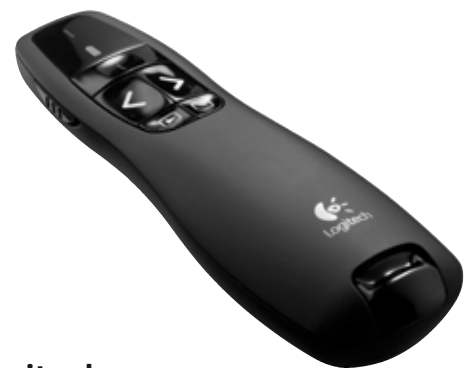
Logitech® Wireless Presenter R400