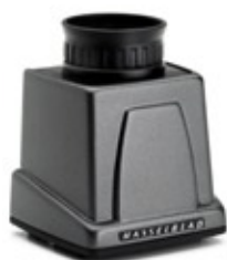
Flessibilità di inquadratura con il nuovo mirino a pozzetto.

Pellicola o digitale? La H3D si trova ugualmente a proprio agio in entrambi i formati, indipendentemente dal fatto che i motivi della scelta siano di ordine creativo o pratico. L'unità di acquisizione digitale della H3D può essere staccata ed utilizzata su un banco ottico controllato dal segnale di sincronizzazione del flash proveniente dall'otturatore del banco ottico. È essenziale che il sensore sia pulito e privo di polvere. Il design modulare della fotocamera consente di accedere ad esso e pulirlo facilmente, facendo così risparmiare ore di fotoritocco.