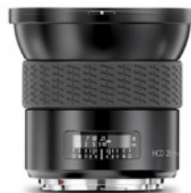
Obiettivo HCD con Full-Frame da 28mm: una qualità di immagine straordinaria esente da distorsioni.

L'innovativa tecnologia della H3D ha consentito di ideare un obiettivo da 28mm sviluppato appositamente ed espressamente per questa fotocamera. Il design è stato ottimizzato per l'area del sensore da 36x48mm della H3D e il risultato è un obiettivo estremamente compatto che può utilizzare appieno la funzione Digital APO Correction ed aumentare ulteriormente la risoluzione dell'immagine.