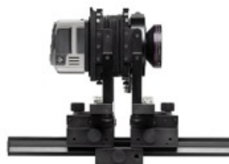
Dorso H3D-39 con i-Adapter utilizzato su un banco ottico.