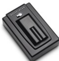
Memorizzazione ultrarapida con Image Bank da 100 GB.