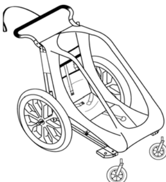
Cheetah CTS / Cougar CTS