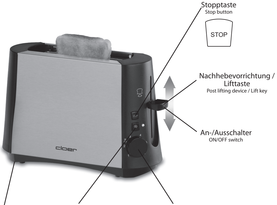
Krümelschublade Crumb tray