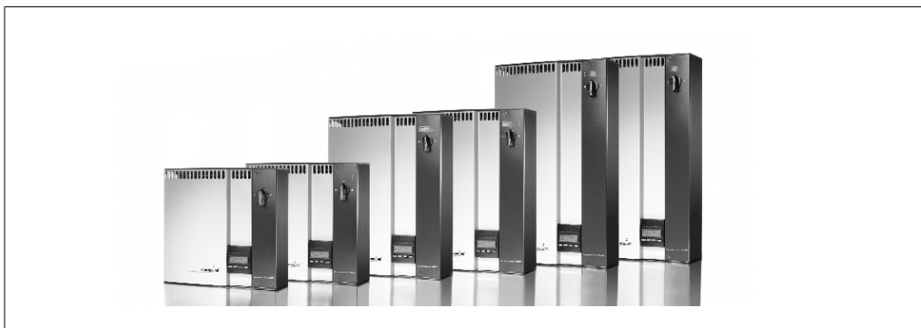
Afbeelding 1.1: PowerStocc-binnenassortiment

Deze handleiding beschrijft Solarstocc fotovoltaïsche omzetters. Deze producten behoren tot de technologisch meest geavanceerde en efficiënte omzetters op de markt en zijn ontworpen om de eigenaar jarenlang te voorzien van betrouwbare zonne-energie.