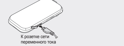
К розетке сети переменного тока