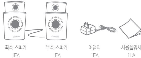
좌측 스피커 1EA, 우측 스피커 1EA, 어댑터 1EA, 사용설명서 1EA

제품을 포장에서 꺼낸 후 제품 구성품이 사용설명서와 일치하는지 확인하십시오.