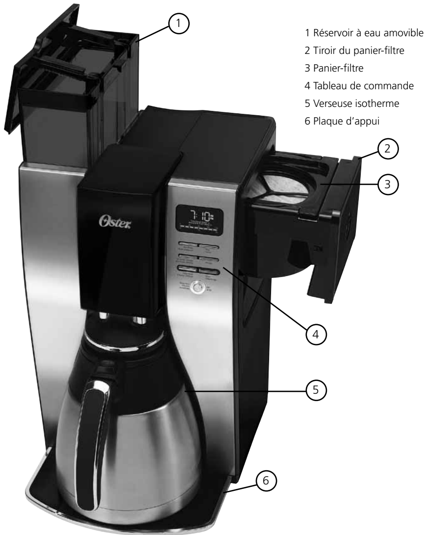
SCHÉMA DES PIÈCES