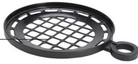
Plat à pocher