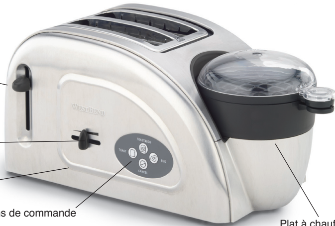
Plat à chauffer