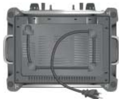
Modèle 4KPTT890 Grille-pain à 4 tranches