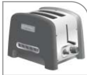
Modèle 4KPTT780 Grille-pain à 2 tranches