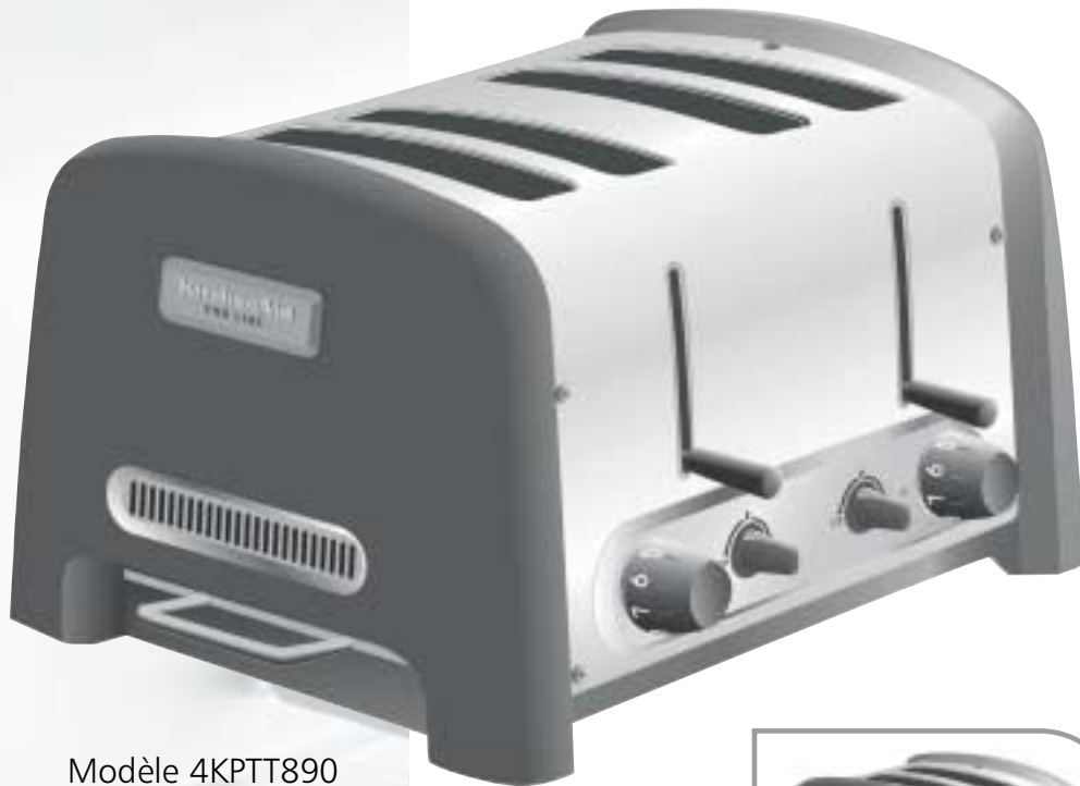
Modèle 4KPTT890 Grille-pain à 4 tranches