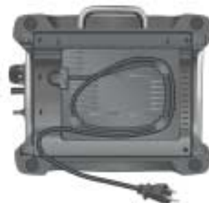
Modèle 4KPTT780 Grille-pain à 2 tranches