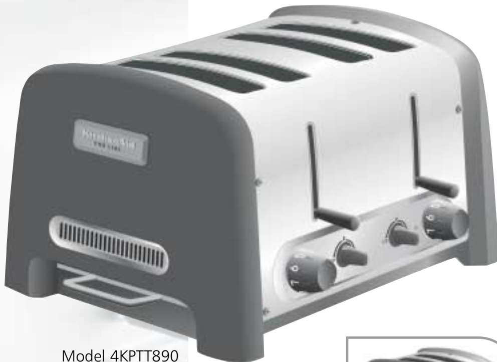
Model 4KPTT890 4-slice Toaster