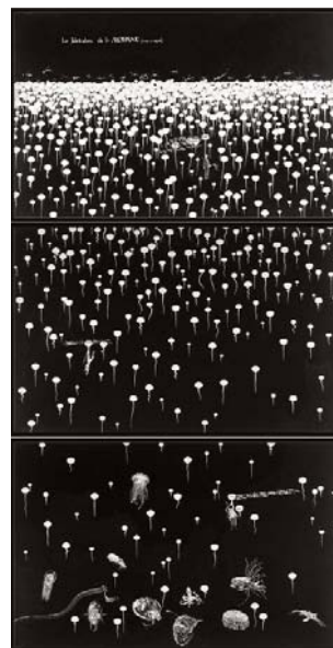
Sans Titre (La fabrication de la mousse) , 2005 Collection particulière, Grèce