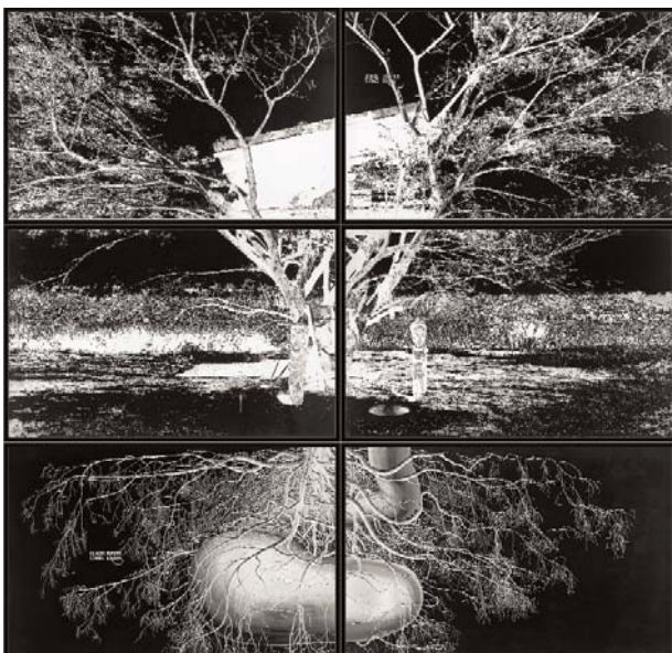
Sans Titre (Haus Insite) , 2005 Collection particulière, Grèce