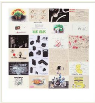
Sans Titre (Le Gâteau) , 2006