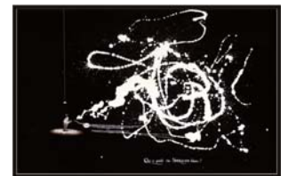
Sans Titre (Spermato blanc) , 2006 Collection Claude Berri