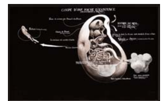
Sans Titre (Coupe d'une poche d'existence) , 2006.