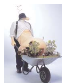
Le Prince des vents , 2003. Coll. part., Paris