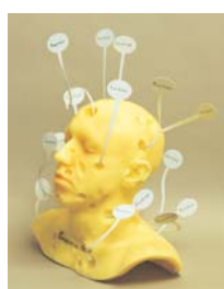
Emmental Head , 2003 Coll. part., Paris