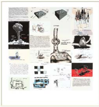
Sans Titre (avec le terrier) , 2005 Collection particulière, Paris