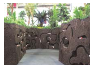
Le Gâteau , 2004