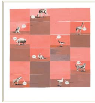
Sans Titre (Projet Méga Maquette) , 2006.