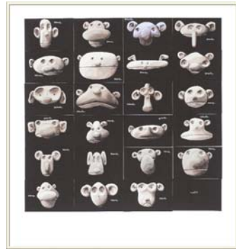
Sans Titre (Tchimp) , 2006 Collection Claude Berri