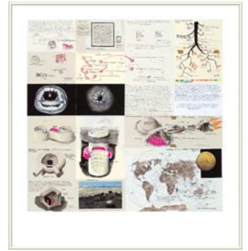
Sans Titre (Projet Méga Maquette) , 2006.