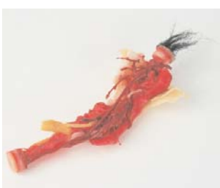
Trou de balle dans la tête , 2001 Collection Renos Xippas, Athènes