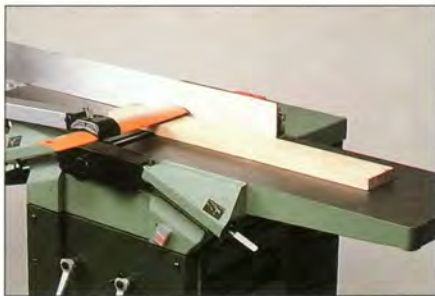
LE DEGAUCHISSAGE EN REGULARITE A platou sur chant. Très longue table d'attaque facilitant le travail des grandes pièces.