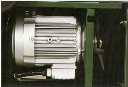
Moteur individuel d'avance Puissance 0,33 CV. 2 vitesses d'avance disponibles : 5 et 12 m/mn pour ébauche et finition. Puissance, rendement et régularité garantis.