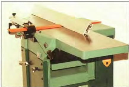
Guide dégau inclinable Avec fixation sur la table de sortie. Inclinaison de 0 à 45° avec indexage de degré en degré sur secteur gradué.