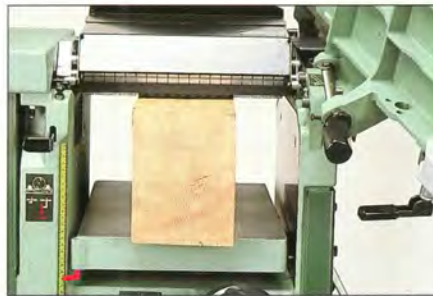
LE RABOTAGE EN FINESE Hauteur de rabotage jusqu'à 230 mm. Bâti monobloc moulé et guidage par fût fourreau en fonte, pour une rigidité exceptionnelle.