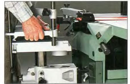
LE MORTAISAGE AVEC RAPIDITE Mortaiseuse amovible et à montée indépendante avec levier de commande unique et butées de position.