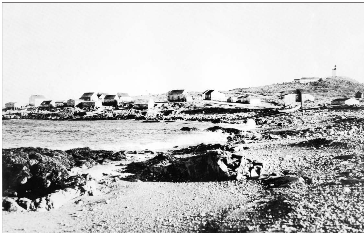
➤ Anse à Tavet appelée désormais Anse à l'Allumette.