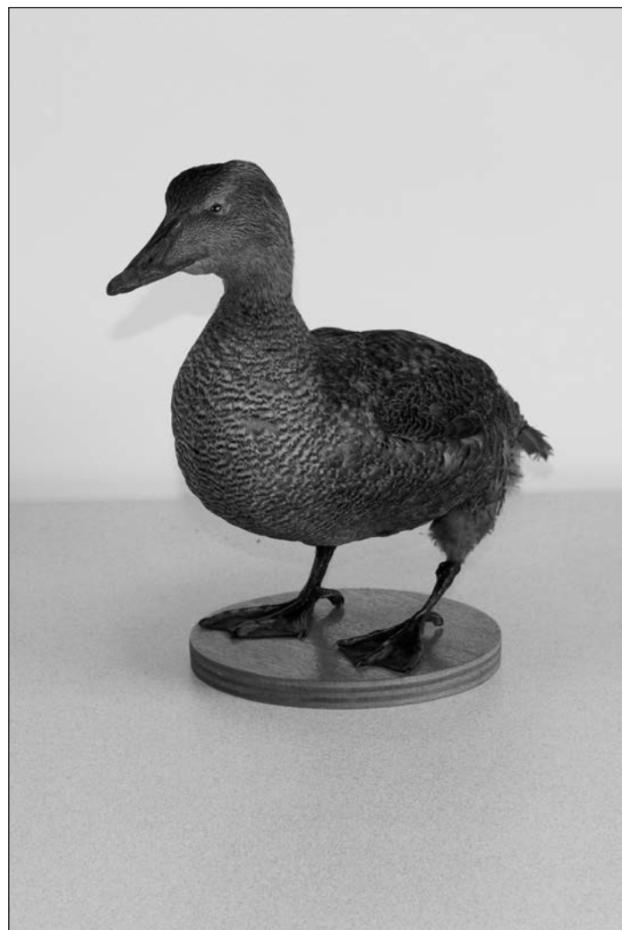
➤ EIDER (collection de l'Arche)

Suite à différentes questions posées sur ce sujet et au regard de plusieurs constatations effectuées par le service de l'ONCFS, il semble important d'apporter quelques précisions sur cette activité.