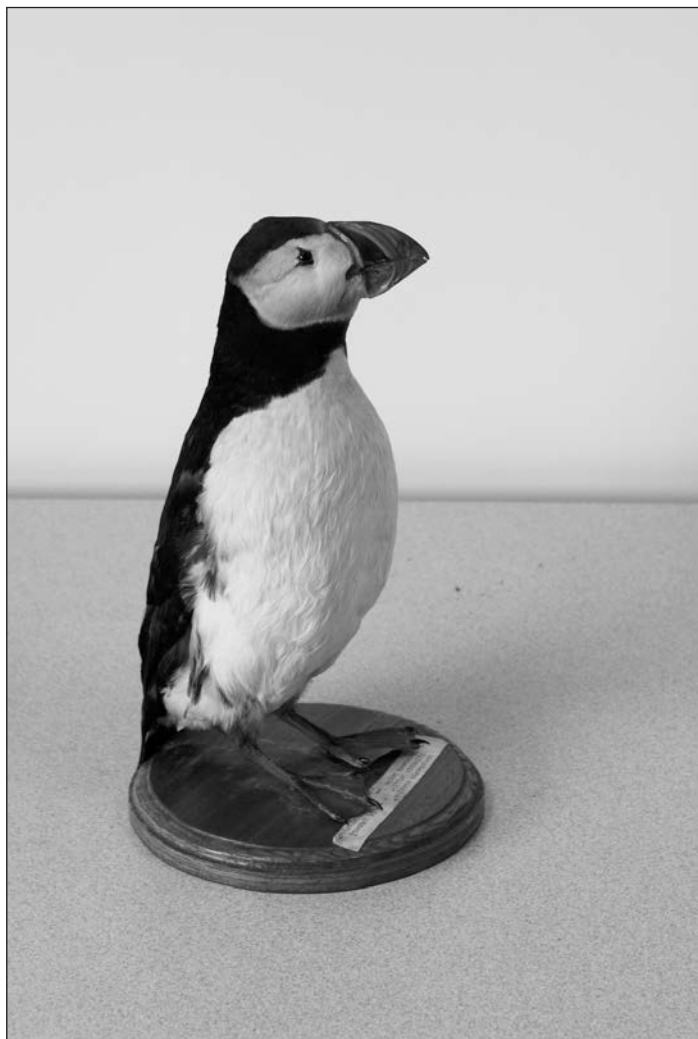
➤ MACAREUX MOINE (collection de l'Arche)