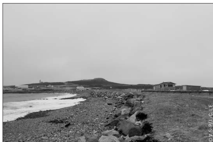
➤ Anse à l'Allumette (mars 2012)

Notre journal tient cette semaine à souligner un anniversaire un peu oublié ! Il est lié à l'histoire de la grande pêche sur le Grand Banc de Terre-Neuve et de ces valeureux Terre-Neuvas qui partaient de chez eux pour de longues campagnes de pêche souvent, hélas, au péril de leur vie ! C'est le cas des marins du navire « La Clarisse ». Ce brick de 105 tonneaux de Granville fit naufrage il y a 165 ans, le 9 avril 1847, avec à son bord 77 marins officiellement enrôlés et 7 jeunes enfants Bretons embarqués clandestinement.