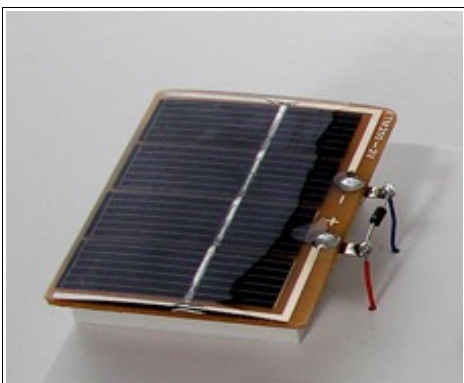
Panneau solaire photovoltaïque

Quand l'énergie nécessaire dépasse la quantité fournie par une seule cellule, les cellules sont regroupées pour former un module photovoltaïque, parfois désigné de manière ambiguë sous le terme de panneau solaire. De tels modules ont été dans un premier temps utilisés pour alimenter des satellites en orbite, puis des équipements électriques dans des sites isolés. La baisse des coûts de production élargit le champ d'application de l'énergie photovoltaïque à la production d'électricité sur les réseaux électriques.