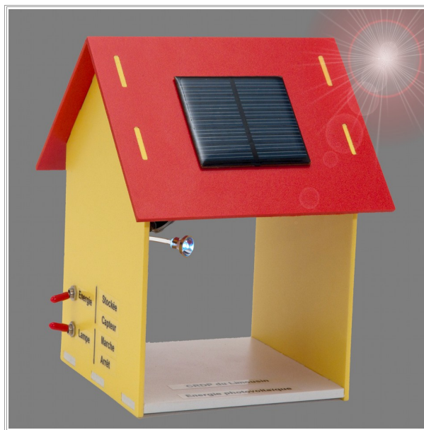
Utilisation directe de l'énergie

L'énergie électrique est directement transmise à la lampe.