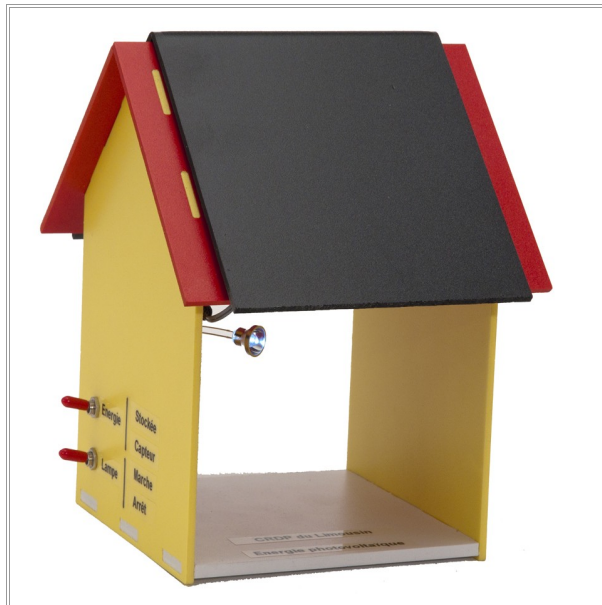
Utilisation en mode « stockage de l'énergie »

Afin de faire face au problème évoqué plus haut il s'avère donc nécessaire de stocker le jour l'énergie. Le stockage de l'énergie se fait sous forme d'énergie électrique stockée dans un condensateur. On pourra par exemple ainsi restituer cette énergie la nuit.