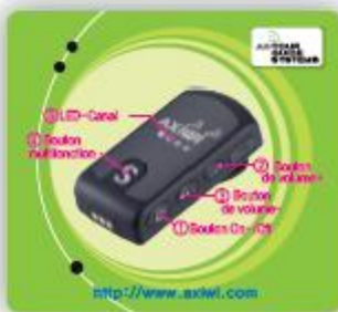
Guide d'utilisation rapide