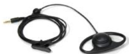
Ecouteur (The socket must be 3.5mm 4-pole of US-type)