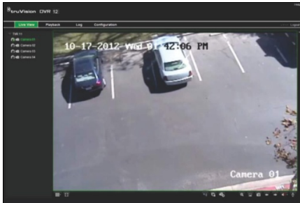
Figure 4 : Interface du navigateur Web