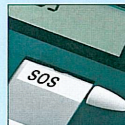
Touche d'appel d'urgence