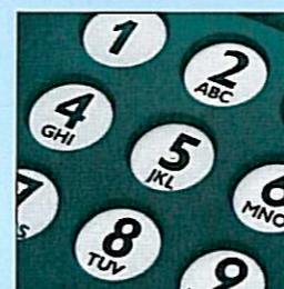
Grandes touches avec point de contact sensible