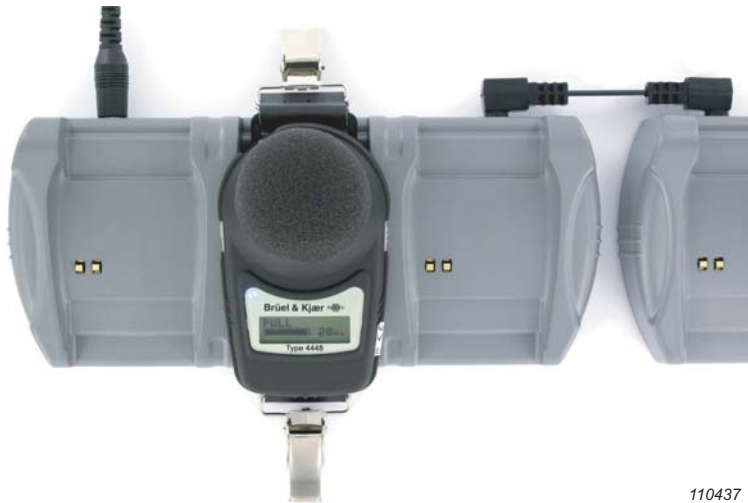
Fig. 4 Utilisation d'une seule prise secteur pour deux chargeurs

Type 4448 se recharge à l'aide d'un chargeur intelligent de type "drop-in". Chaque chargeur peut accueillir jusqu'à trois exposimètres. La recharge des exposimètres est contrôlée individuellement. On peut ainsi mettre en place dans les sabots, des appareils dont l'état des batteries peut être très différent, la recharge étant stoppée automatiquement quand le maximum d'autonomie est atteint. Il est possible de laisser l'exposimètre sur le chargeur sans aucun risque de surcharge. Il est également possible de relier entre eux jusqu'à quatre chargeurs et procéder à la recharge de 12 exposimètres simultanément, en ne raccordant qu'un seul chargeur à une prise secteur.