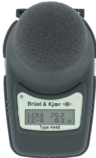
Fig. 3 Type 4448-B mesure simultanément le L_{Aeq} et le L_{Ceq} et affiche le L_{Ceq} - L_{Aeq}