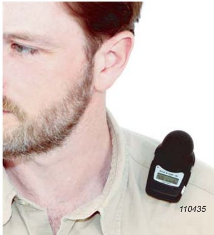
Fig. 1 Afin d'accompagner le travailleur dans toutes ses activités, Type 4448 a été conçu compact, robuste, léger et sans fil

Face à ces coûts importants, celui de la prévention est modeste. Il est important de pouvoir détecter les salariés exposés à des niveaux sonores élevés avant qu'ils ne subissent une dégradation de l'audition. Il est possible alors de baisser les niveaux sonores sous les seuils dangereux en diminuant le bruit des machines, en traitant l'acoustique des lieux de travail, en réduisant la durée d'exposition au bruit et/ou en équipant les opérateurs de Protection Individuels Contre le Bruit adaptés.