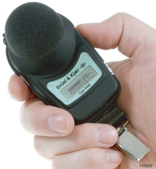
Fig. 2 Autonomie et durée de stockage encore disponibles, sont affichées sur l'écran LCD du Type 4448

Doté d'un processeur numérique du signal (Digital Signal Processor DSP), le dosimètre Type 4448 peut mesurer simultanément tous les paramètres permettant de qualifier l'exposition au bruit des salariés. Le paramétrage de l'instrument n'est plus nécessaire. Par ailleurs, l'utilisation d'un DSP permet d'ajouter facilement de nouvelles fonctionnalités à l'exposimètre et, d'effectuer des mises à jour simplement, garantissant ainsi la pérennité de l'investissement de base.