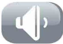
Faible niveau sonore