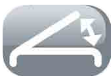
Oscillation de flux d'air