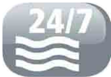
Possibilité de drainage permanent