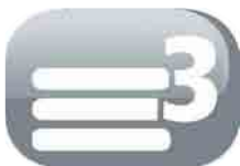
3 couches de filtre