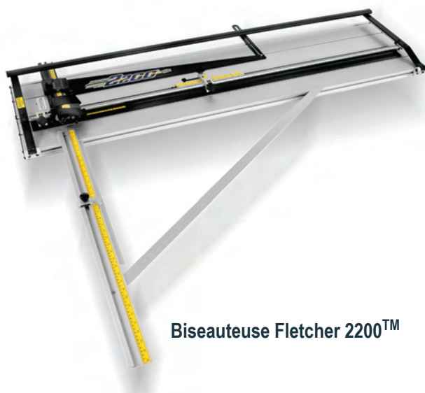
Biseauteuse Fletcher 2200™

C'est la seule biseauteuse dont vous aurez besoin pour déterminer les dimensions d'un passe-partout, faire des coupes en biseau, ou des rainures en V... en particulier quand la précision est une de vos priorités.