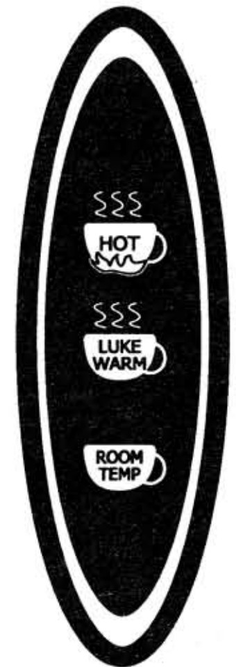
Panneau de contrôle