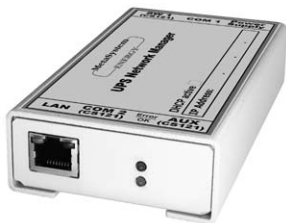
3 108 84

3 108 81 - 3 108 82 - 3 108 83 - 3 108 84 - 3 109 06 - 3 109 07