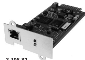
3 108 82