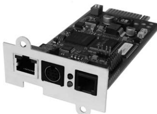
3 109 07