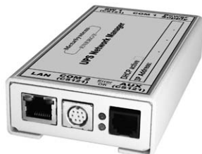
3 109 06