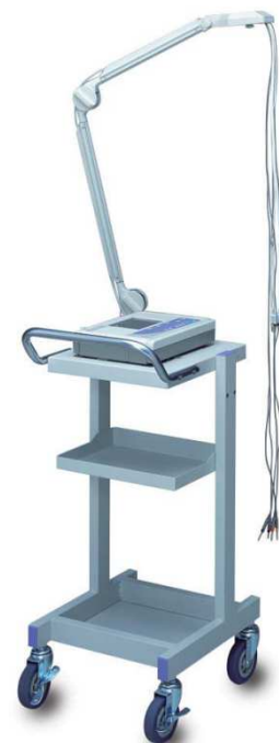
Option: chariot + bras porte électrodes

•Un ECG 12 dérivation (impression 3 pistes en 4 groupes) avec grand écran LCD Compact, très léger (1,5 kg) et facile à utiliser, l'électrocardiographe Nihon Kohden Cardiofax S-1150 est un ECG 3 pistes particulièrement apprécié des professionnels. Facilement transportable, sa taille correspond au format d'une feuille A4 et son poids n'est que de 2,5 kg batterie comprise. Equipé d'un écran LCD rétro-éclairé, il vous permet de visualiser confortablement les tracés et les différentes informations avec une clarté insoupçonnée.