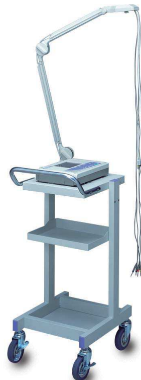
Option: chariot + bras porte électrodes