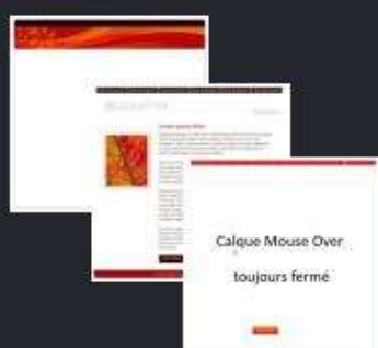
Superposition des 3 calques