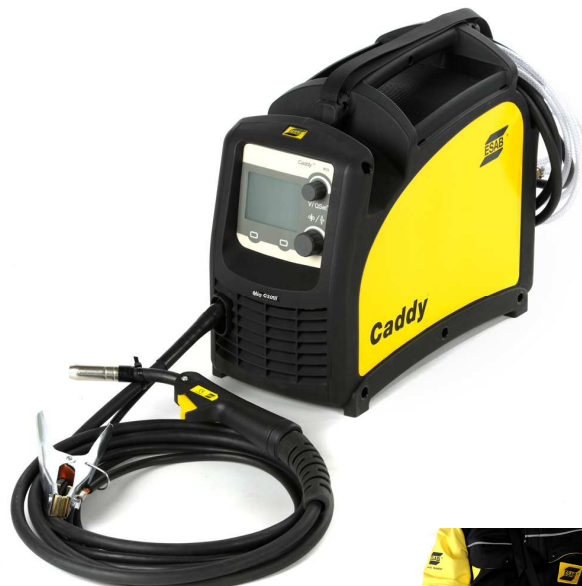
Fourni avec bandoulière.