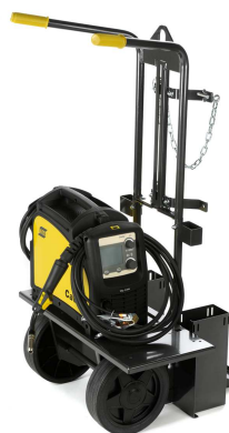
Chariot - pour un transport facile des bouteilles de gaz et Caddy® Mig.