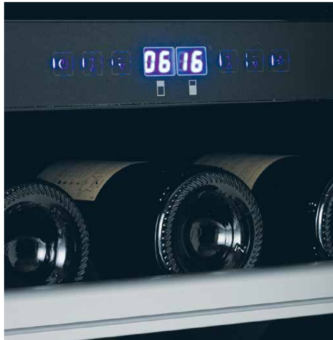
Panneau de commande Touchpad et affichage numérique de température