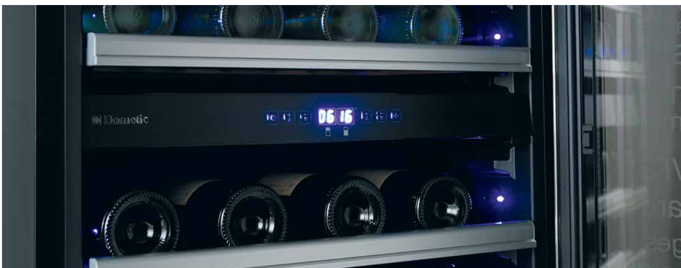
Zones de température séparées pour les vins rouges et les vins blancs.