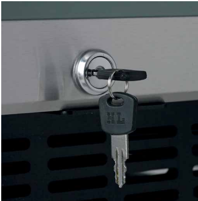
Porte verrouillable, 2 clés fournies à la livraison