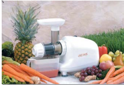
existe aussi en finition chromée