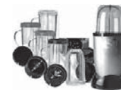
moulin légumes électrique

Vous ne produisez des caviars que rarement, en petites quantités pour des événements ? Un petit moulin légumes à multiples récipients, de type Magic Bullet, à 50 euros fera l'affaire, comme pour une utilisation en petite famille.