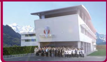
Traitement de surface