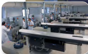
Atelier de production

● Des prix non limitatifs pour mettre le traitement implantaire à la portée du plus grand nombre et une prothèse de qualité.