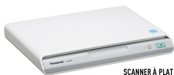
SCANNER À PLAT KV-SS081