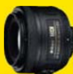
AF-S DX NIKKOR 35mm f/1.8G

Permet d'envoyer directement les photos sur un smartphone ou une tablette compatible (1)