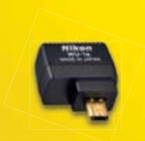
Transmetteur sans fil pour mobile WU-1a

Permet d'envoyer directement les photos sur un smartphone ou une tablette compatible (1)