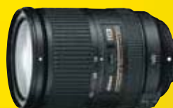
AF-S DX NIKKOR 18-300mm f/3.5-5.6G ED VR

Idéal pour les portraits, permet de créer de superbes flous d'arrière-plan