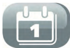
Programmation sur 24h