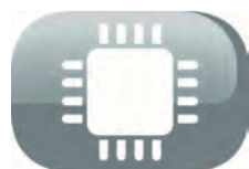
Techonologie Fuzzy Logic