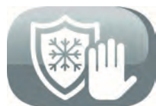
Fonction hors gel