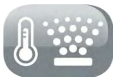
Brume fraîche et vapeur chaude