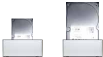
Disque dur 2,5"