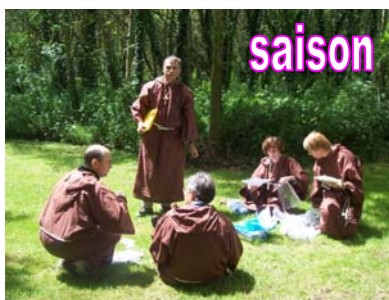
Les moines en pleine méditation