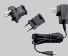
Adaptateur secteur international 010-10723-00