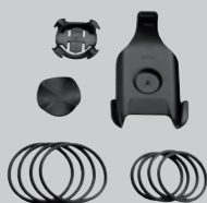
Support chariot 010-11805-10