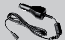
Câble allume-cigare 010-10851-11