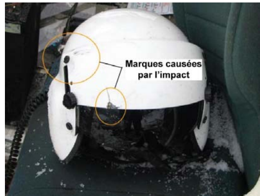
Photo 1. Casque du pilote

Le pilote instructeur ne portait pas de casque 5 et il a subi de graves blessures au visage et à la tête. L'autre pilote portait un casque et il n'a pas subi de blessures à la tête; des marques sur le casque montrent qu'il y a eu contact avec la structure de l'hélicoptère pendant l'impact (voir la photo 1).