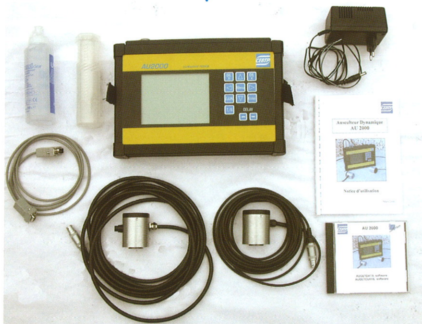
L'AU 2000 est livré complet et prêt à l'emploi