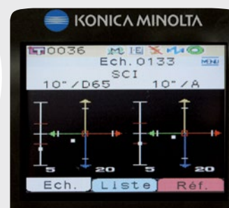
Graphique d'écart de couleur