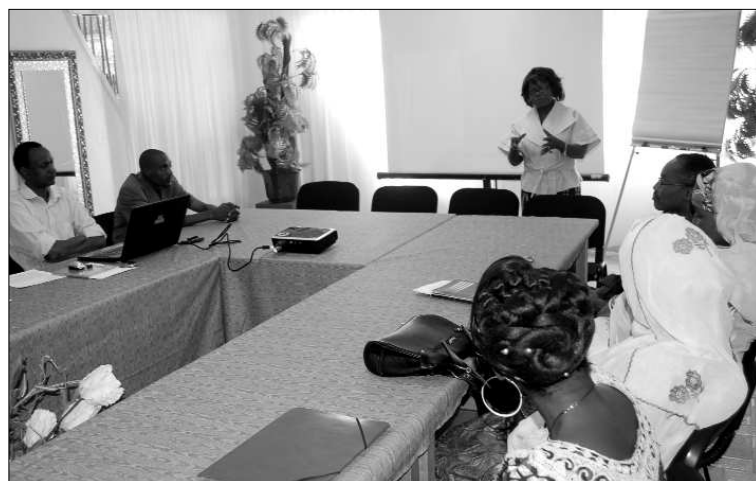
Une vue des participants à la formation

produits de traitement de l'eau. A l'issue de cet atelier, les formateurs doivent être capables d'organiser et de faciliter la formation des femmes relais responsables des clubs de discussion sur les problèmes de santé et le développement des 42 villages de la région de Niamey et 140 autres de la région de Maradi. Ces deux régions sont en effet celles qui