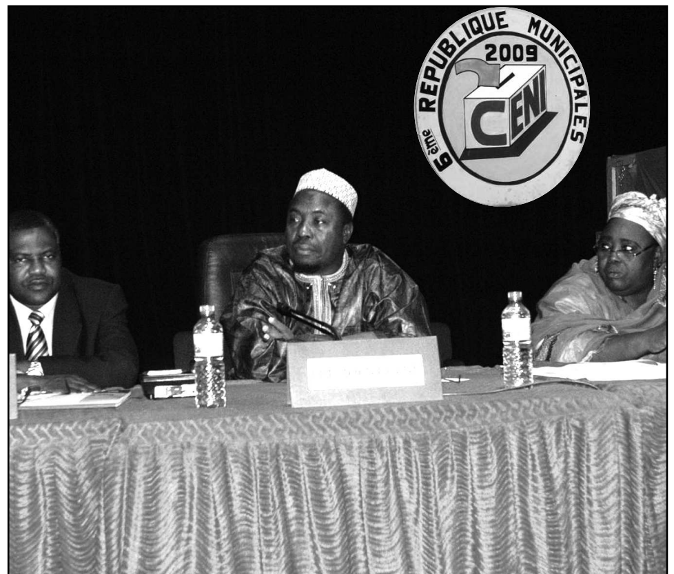
La table de séance du bureau de la CENI lors de la proclamation des résultats