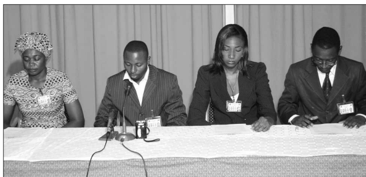
Les observateurs de RIOE...