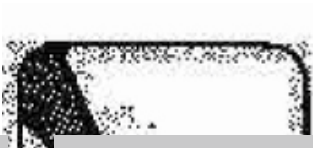
SOLE OF FOOT