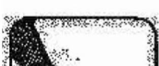
PLANTE DES PIEDS