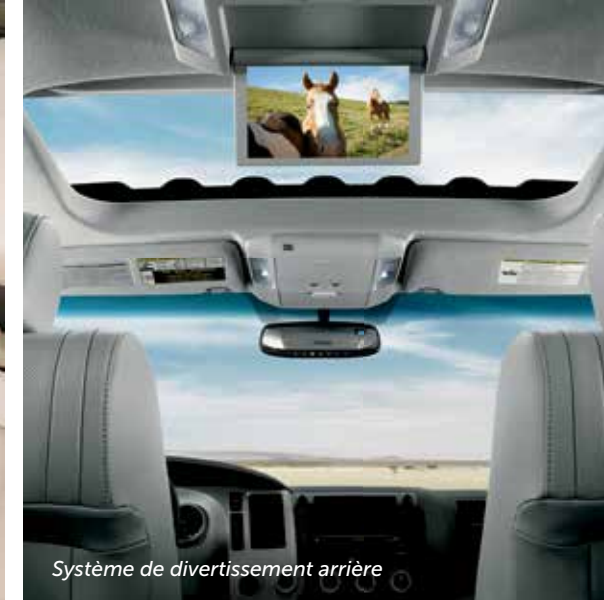
Système de divertissement arrière