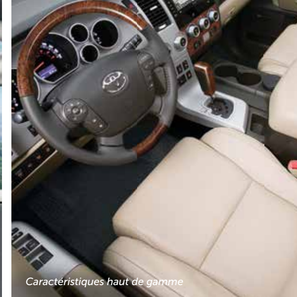
Caractéristiques haut de gamme