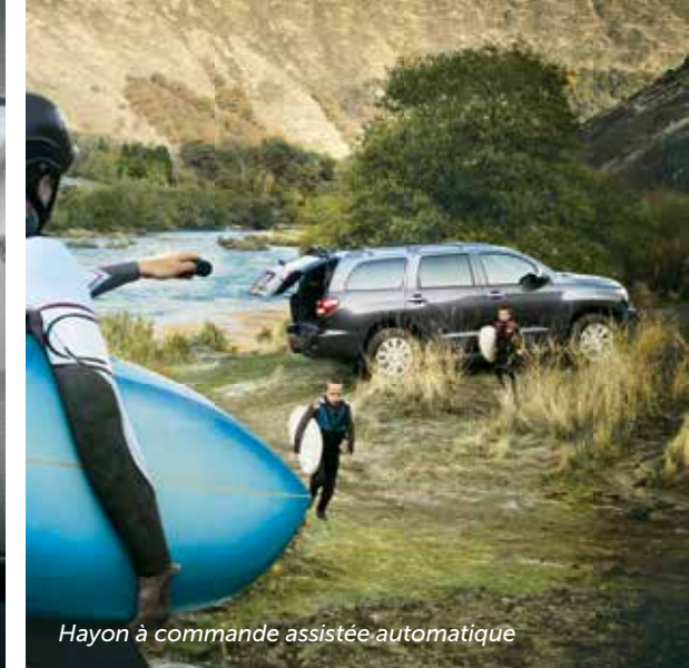
Hayon à commande assistée automatique