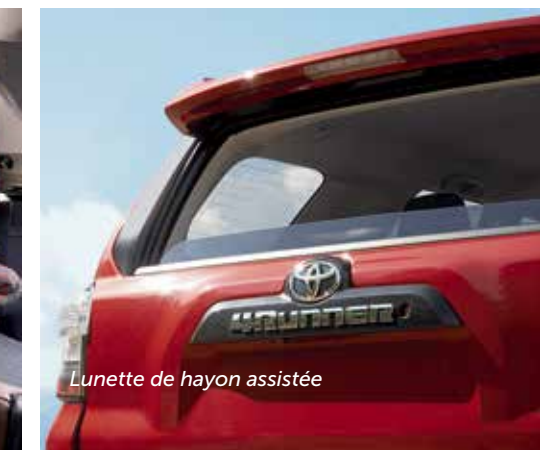
Lunette de hayon assistée