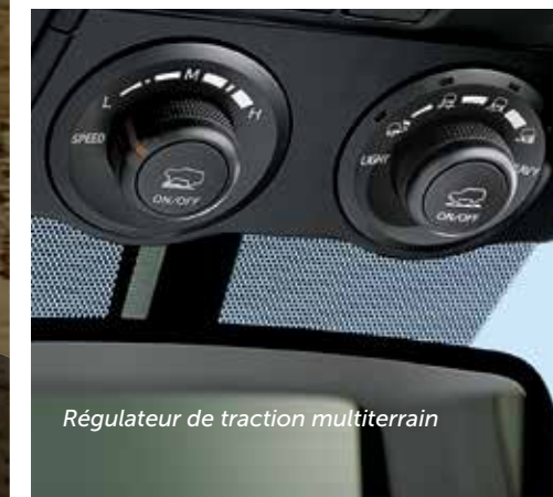
Régulateur de traction multiterrain

SYSTÈME AUDIO À ÉCRAN* Le système audio à écran 4 comporte un écran tactile de 6,1 po avec lecture musicale en continu sans fil Bluetooth MD3 et une fonction « texte à voix » unique qui convertit les messages texte de votre téléphone en messages vocaux que vous pouvez écouter sur les haut-parleurs du véhicule.