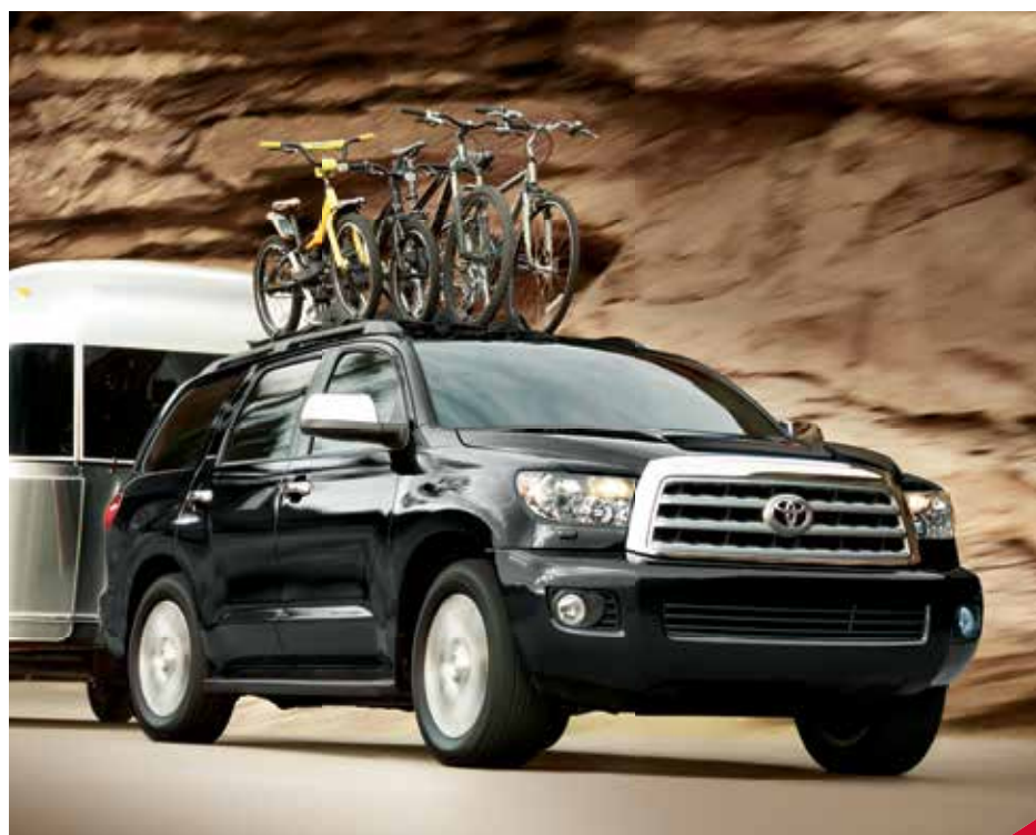
Sequoia Limited montré en Noir.