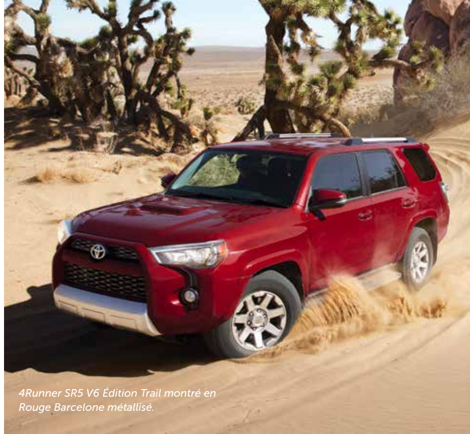
4Runner SR5 V6 Édition Trail montré en Rouge Barcelone métallisé.