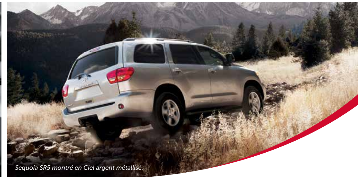
Sequoia SR5 montré en Ciel argent métallisé.