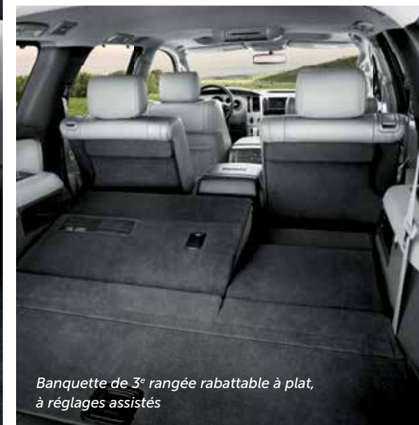
Banquette de 3 e rangée rabattable à plat, à réglages assistés