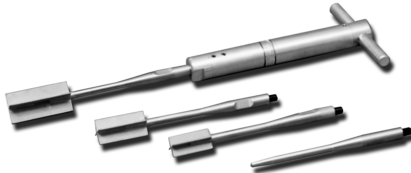
Figure 1: Trois formats de palettes du H-60

La gamme de mesure de l'appareil est de 0 à 260 kPa. La précision de l'appareil est de 10%.