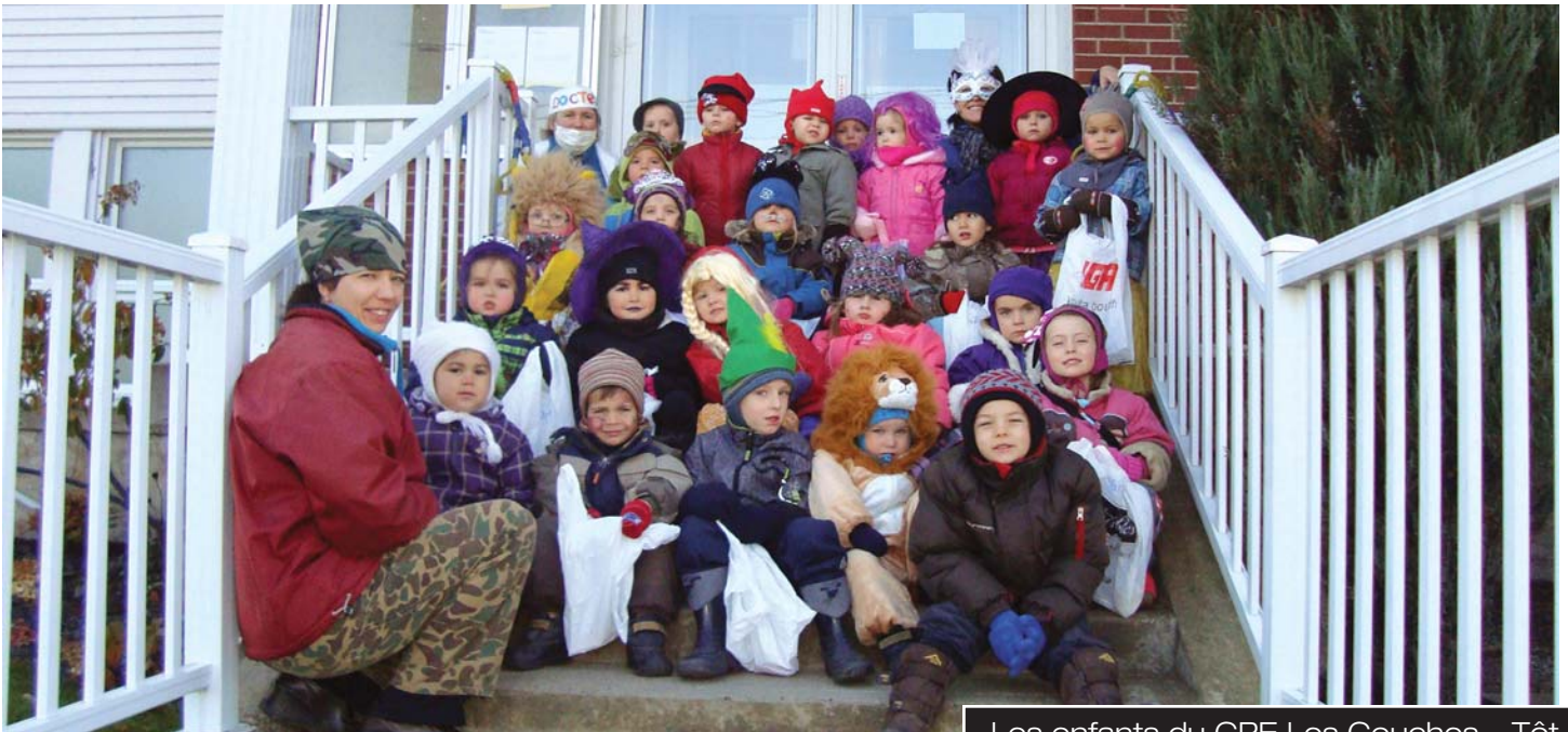
Les enfants du CPE Les Couches... Tôt

MENSUEL D'INFORMATIONS DES GENS DE SAINT-BERNARD