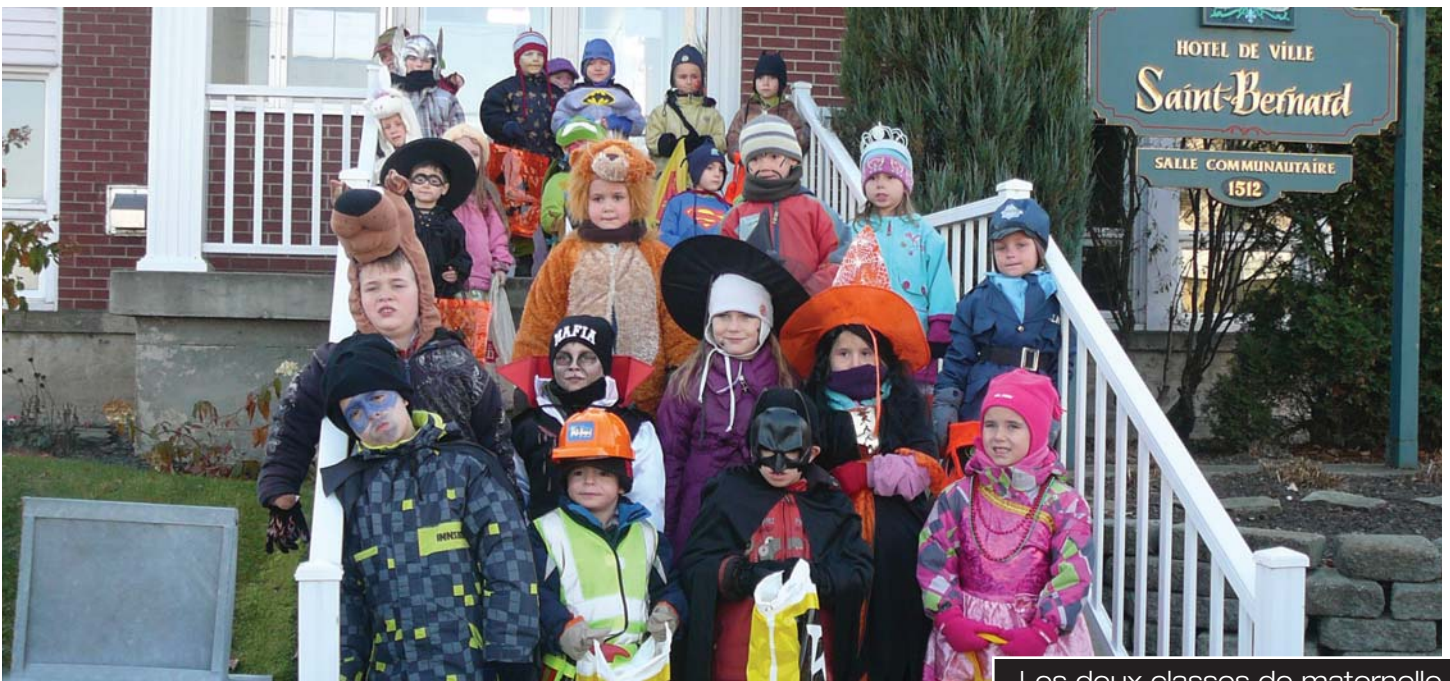
Les deux classes de maternelle

POUR L'HALLOWEEN: DE LA GRANDE VISITE À L'HÔTEL DE VILLE!