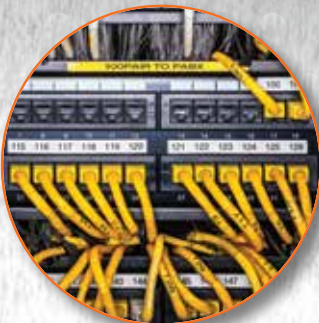
Systèmes de transmissions de données