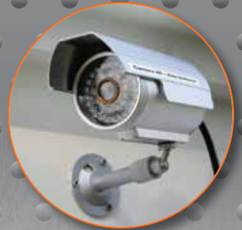
Systèmes de sécurité