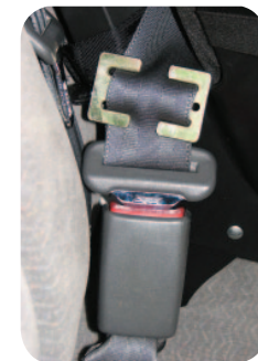
Pince de sécurité