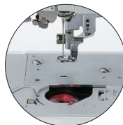
Canette à fixation rapide et capteur de fil