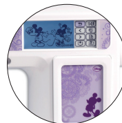
Écran ACL tactile