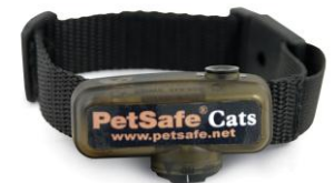
Collier supplémentaire pour chats