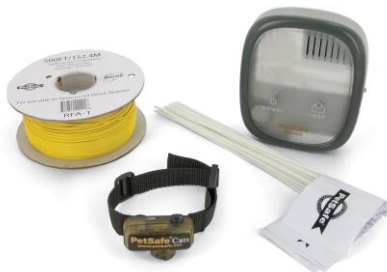
Systeme anti-fugue petit chiens

Tous les colliers-récepteurs PetSafe sont compatibles avec les systèmes anti-fugue, il suffit d'acheter un collier supplémentaire pour chaque animal.