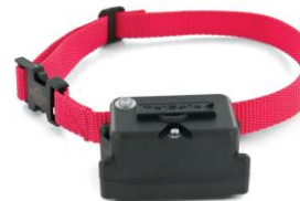
Collier supplémentaire pour chien têtus