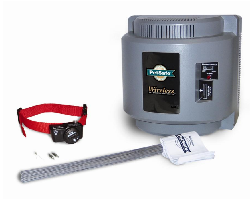
Clôture anti-fugue sans fil WIRELESS

Il n'y a aucun fil à enterrer, ce système peut-être utilisé avec un nombre illimité de chiens.