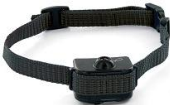
Collier anti-aboiement Deluxe pour petits chiens

Certains ont des fonctionnalités supplémentaires comme un indicateur de batterie faible ou un indicateur de niveau.