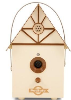
Maisonnette anti-aboiement ultrasons intérieur