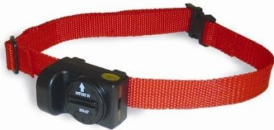
Collier anti-aboiement à ultrasons réglable

Ce type de stimulation peut être émis par un collier ou par un boîtier Indépendant.