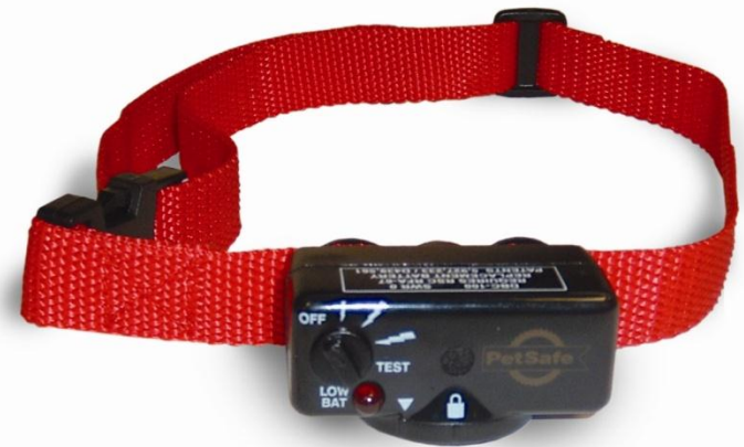
Anti-aboiement PetSafe Deluxe

Certains sont résistants à l'eau alors que d'autres sont étanches.