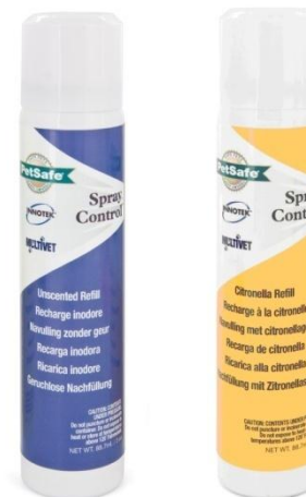
Recharge spray inodore et à la citronnelle