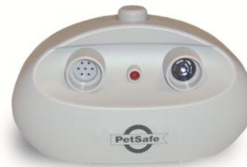
Système anti-aboiement à ultrasons intérieur