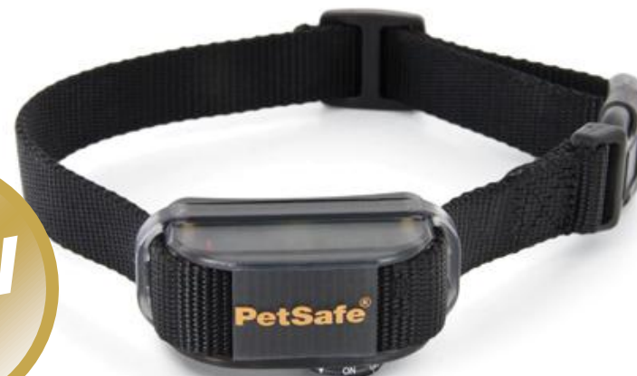
Collier anti-aboiement par vibration